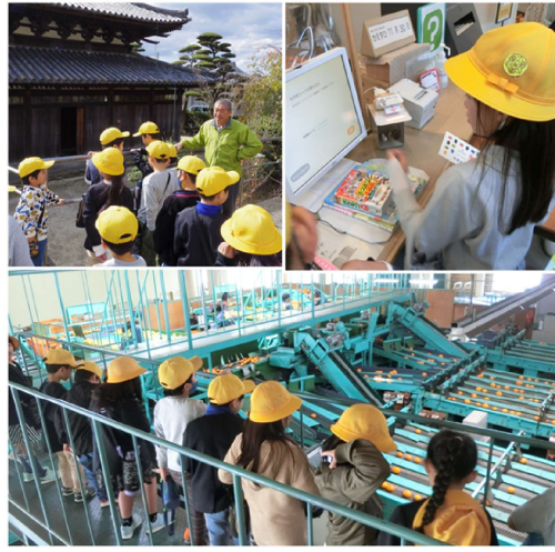
2年生 善福院、営農センター、下津図書館見学 11/14(火)16(木)