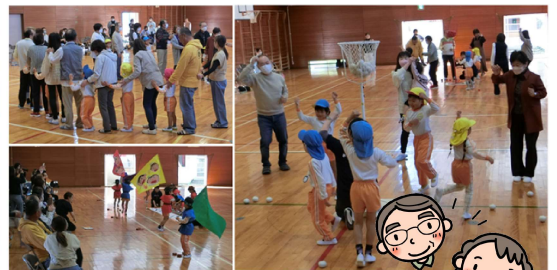
幼稚園 祖父母参観 10/31(火)