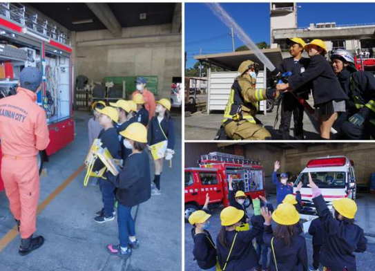
3年生 消防署見学 11/8(水)