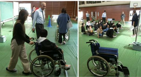
5年生 親子車いす体験 10/31(火)