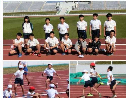
6年生 市小学校陸上記録会 10/17(火)