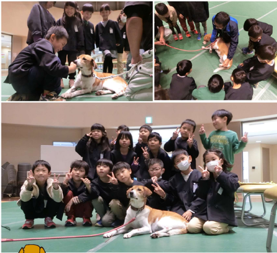
1年生 動物愛護センター見学 11/13(月)