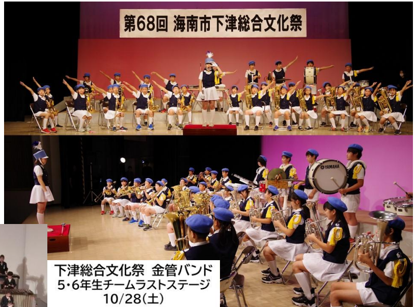
下津総合文化祭 金管バンド 5・6年生チームラストステージ 10/28(土)

ステージでは「小さな恋のうた」と「カントリーロード」を演奏し、最後はポーズとかけ声で締めくくりました。今年のチームは金管楽器の音がきれいで音量も大きく、聴き応えがありました。また、パートごとに起立したり、リズムに合わせてみんなで体の向きを動かしたりして、視覚的にも