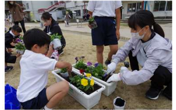
幼稚園 11/9(木) 1・2年生 11/16(月) 世代間交流事業 チューリップ・パンジーを植える会