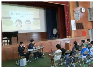
教育講演会 育友会・4・5・6年生 10/31(火)