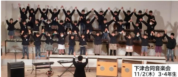
下津合同音楽会 11/2(木) 3・4年生

楽しめる演奏でした。客席からたくさんの拍手を送っていただきました。演奏前、子どもたちは普段より緊張気味でしたが、演奏後には、とても良い笑顔がいっぱい。「よくやった！」という達成感でいっぱいでした。