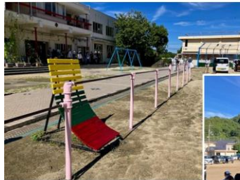
育友会 奉仕作業 8/27(日)

育友会環境部の皆様をはじめ、ご協力いただいた育友会の皆様、ありがとうございました！