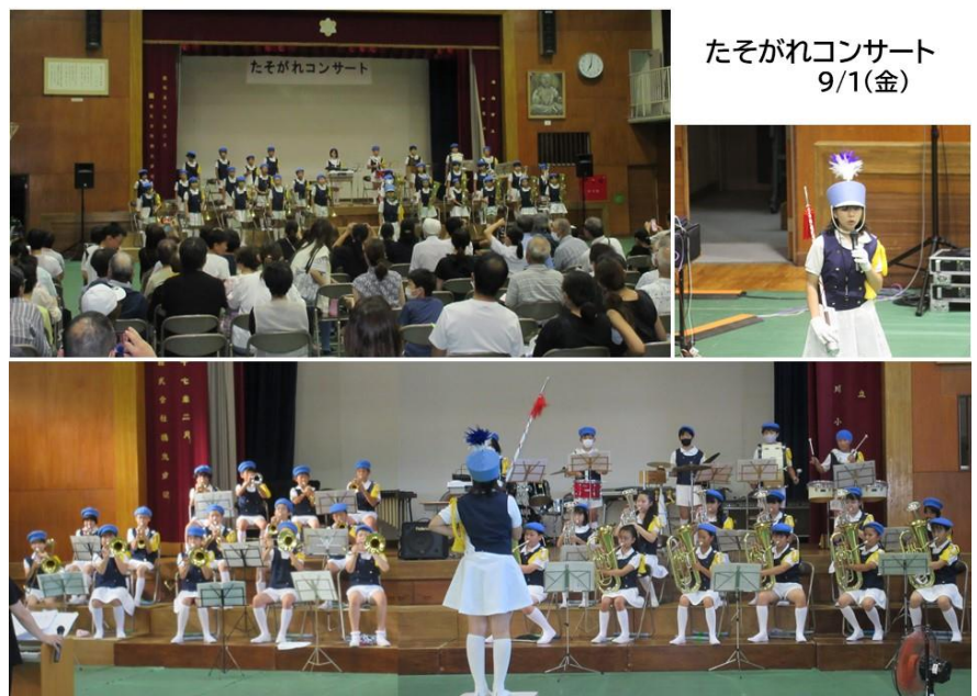
たそがれコンサート 9/1(金)

コンサート開催にあたって御尽力いただいた育友会会長様、文化部の皆様にご心より感謝申し上げます。